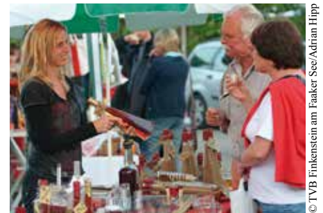
Beliebt bei Einheimischen und Gästen: Der Faaker Bauernmarkt startet am 4. Mai in die Sommersaison.

Faaker Bauernmarkt: Treffpunkt mit Volksfestcharakter Schauen, schlemmen und shoppen nach Herzenslust – dafür ist der Faaker Bauernmarkt seit 30 Jahren weit über die Gemeindegrenzen hinaus bekannt. Der beliebte Treffpunkt für Jung und Alt startet heuer am Donnerstag, den 4. Mai. An insgesamt 21 Donnerstagen bis 28. September (ausgenommen European Bike Week) kann in angenehmer Atmosphäre Speckbrot, Honigschnaps, Apfelsaft und Co. genossen werden. Handgefertigte, regional produzierte Mitbringsel von einem der Bastel- und Künstlerstände ergänzen die umfangreiche Angebotspalette. Am Marktgelände zu flanieren und Schmanckerln zu genießen, gehören einfach zum heimischen Sommer – wie Mittagsgogel und Faaker See.