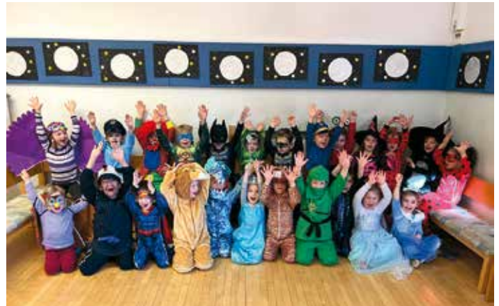
Die „Füleinitzer“ Kindergartenkinder feierten eine lustige Faschingsparty.

„Fülei, Fülei“ hallte es am Faschingsdienstag mehrfach und lautstark durch die Räumlichkeiten des Kindergartens Fürnitz. Spiel, Spaß und gute Laune standen im Mittelpunkt des Vormittags. Nach lustigen Wettspielen und Tänzchen gab es eine Stärkung mit Faschingskräpfen, die von Bürgermeister Christian Poglitsch spendiert wurden. Im Anschluss begeisterte der Kasperl mit seiner „Weltraumreise“ die Kinder. Ein gemeinsamer Umzug durch den Ort beendete diesen kunterbunten Tag.