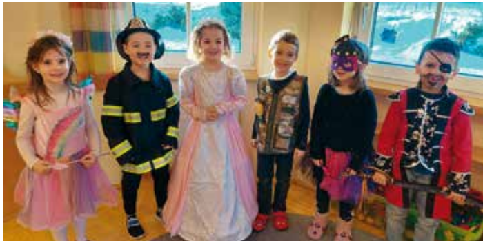
Die Kindergartenkinder schlüpfen in die unterschiedlichsten Rollen und genossen das bunte Treiben in vollen Zügen.