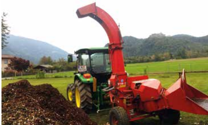
Traktor mit Häcksler von der Firma Piber.