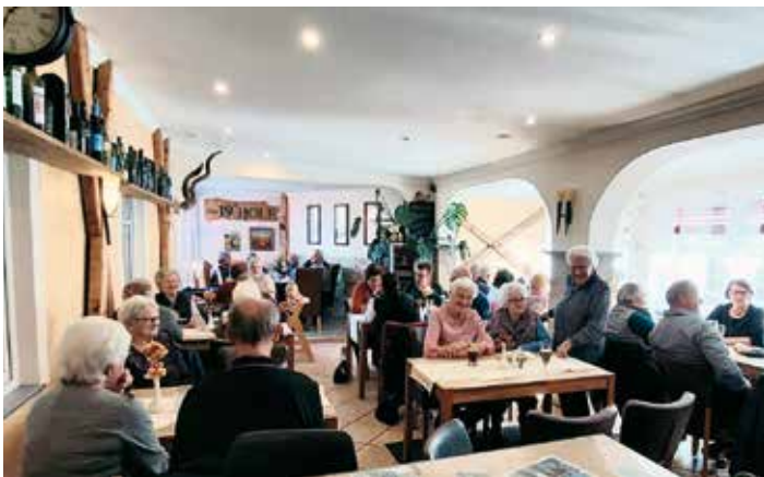
Gelöste Stimmung beim traditionellen Heringssschmaus der OG-Latschach.