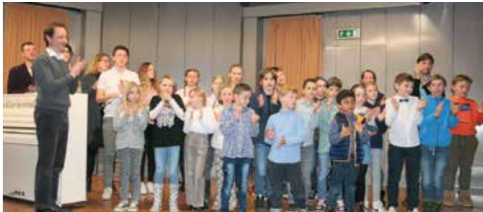
Die Schüler der Slowenischen Musikschule begeisterten das Publikum mit Musikstücken aus dem Wintersemester.

Am Mittwoch, dem 8. 2. 2023, hatten im Kulturhaus in Lednitzen die Schüler der Slowenischen Musikschule ihren gloriösen Auftritt. Sie präsentierten ihren Familien und Freunden am Klavier, auf Flöte, Gitarre, Akkordeon und Schlagzeug die einstudierten Stücke des Wintersemesters.