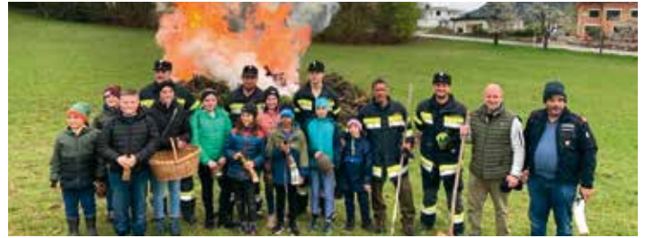
Das Georgifeyer in Oberaichwald.

Lani nam je uspelo, da smo skupno poživali tole starodavno navado. V vasi pod Vinco, ki se imenuje „Lauskeile“ so se znova spoznavali tamkajšnje in nove družine in otroci. Stare pre-