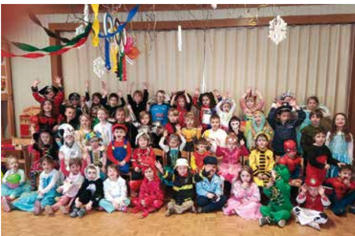
Die Kinder im Kindergarten Finkenstein erlebten eine lustige und farbenfrohe Faschingsparty.

In Anlehnung an das Projektthema „Wintersport in Tirol“ stand eine „Kinder-Winterolympiade“ mit verschiedenen Stationen auf dem Programm. „Gut festhalten, die Fahrt geht los!“ hieß es bei der ersten Station, und schon sausten die Kinder auf den umgebauten Schlitten durch den Gang. Heiß her ging es auch beim Eishockey im Turnraum und bei der Zeitungspapier-Schneeballschlacht. Beim „Curling mit Plastiktellern“ und beim „Schachtelschi-Langlauf“ konnten die jungen Sportler ihre Geschicklichkeit unter Beweis stellen. Zauberhafte Momente bot die „Eiskunstlauf-Station“, bei der mit bunten Tüchern allerlei Kunststücke ausprobiert wurden. Nachdem alle Stationen erfolgreich absolviert waren, ging es zur Siegerehrung. Alle Teilnehmer der Kinderolympiade erhielten die verdiente Goldmedaille. Der Kindergarten Finkenstein bedankt sich herzlich bei Bürgermeister Christian Poglitsch für die Krapfenspende, sowie bei der Volksschule Finkenstein für das Verleihen der Hockeyschläger.