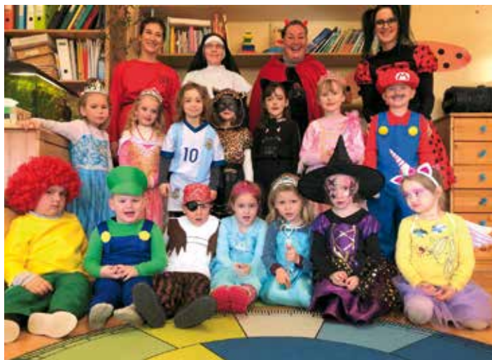
Lustig und bunt ging es am Faschingsdienstag in der KiTa Pinocchio zu.