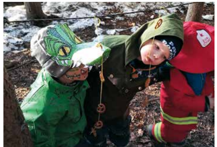
Die Brezeln auf den Schnüren haben die älteren Kinder schon am Vortag vorbereitet.

Wenn im Wald bunte Gestalten auf Sträucher klettern, freihändig Brezeln knabbern, mit Luftballonen Hindernisläufe machen und dazu noch mit Staubzuckerbart Krapfen mampfen, dann weiß man, es ist Fasching im Waldkindergarten.