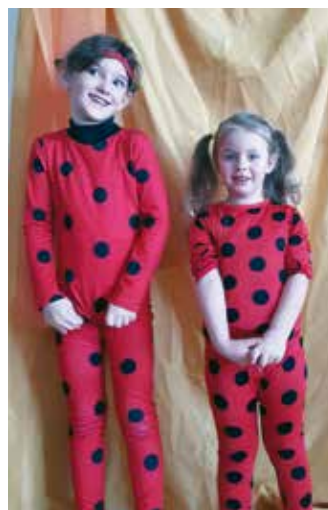
Süße Marienkäfer-Kostüme waren auch zu sehen.

Im Kneippkindergarten Ledenitzen ging es im Februar besonders farbenfroh zu. Die Kinder der Bären- und Mäusegruppe bereiteten sich auf den Fasching vor. Selbstgestaltete Clowns und bunte Murmelbilder verzierten die Wände des Kindergartens und stimmten auf die Faschingszeit ein. Lustige Lieder und Gedichte wurden vorbereitet und sorgten für das ein oder andere Schmunzeln in den Gesichtern der Kinder. Besonders aufregend war ein Experiment, bei welchem sich die weißen Tulpen bunt verfärbten. Der Höhepunkt jedoch war der Faschingsdienstag im Kindergarten. An diesen heißersehten Tag besuchte die Kinder der Zauberer „Magic Felix“, welcher mit seinen Tricks für große Kinderaugen sorgte.