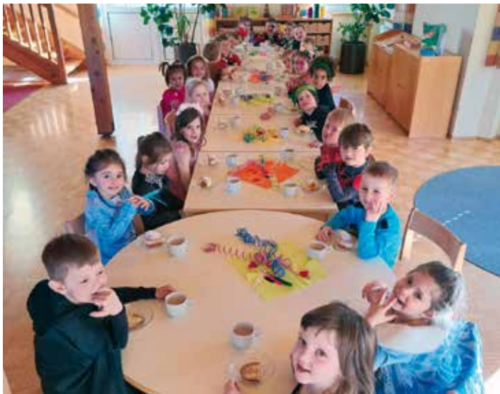
Zum Abschluss der Feier verspeisten die Kinder die köstlichen Faschingskrapfen.