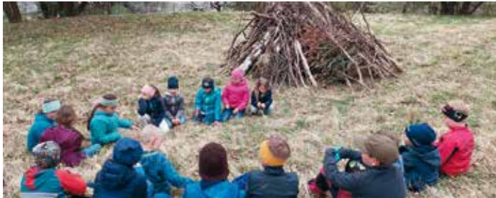
Die Georgijäger unter der Vinca

Nicht mehr lange und die jungen Georgijäger werden wieder den Frühling in unsere Dörfer bringen. Der Dorfgemeinschaft Latschach ist es gemeinsam mit der Volksschule und Jugendfeuerwehr Latschach gelungen diesen für unsere Region so spezifischen Brauch wiederzubeleben. Mit den Kindern zieht eine jahrhundertalte Tradition auch in Zukunft weiter durch unsere Dörfer. Mit dem uralten Brauch ist es gelungen, dass sich Kinder, ansässige und zugezogene Familien, neu kennengelernt haben. Somit sind nun alle in unseren Dörfern angekommen. Bestes Beispiel ist die Ortschaft „Lauskeile“ am Abhang der Vinca, die formell zu Faak am See gehört und wo der Brauch wegen Mangel an Kindern bereits in den 1980er Jahren ausgestorben ist. Hier waren im Vorjahr 20 (!) Mädchen und Buben mit dabei und haben so die erfolgreiche Wiederbelebung geschafft.