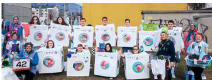
Die Dorfgemeinschaft Gödersdorf wurde mit dem Gödersdorfer Waschsalon beim Villacher Faschingsumzug einmal mehr zum Publikumsliebling gewählt.

Darüber hinaus nahm die Dorfgemeinschaft Gödersdorf auch heuer wieder als Fußgruppe am Villacher Faschingsumzug teil. Diesmal lautete das Motto „Gödersdorfer Waschsalon“ – die kreativen Kostüme wurden auch dieses Jahr von den Mitgliedern selbst entworfen und hergestellt. Diese Kreativität wurde belohnt, denn die Dorfgemeinschaft wurde heuer bereits zum vierten Mal in Folge mittels SMS-Voting zum Publikumsliebling gewählt und darf sich wieder über den Draustädter Publikumspreis freuen.