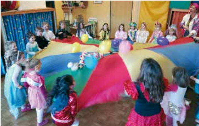
Die maskierten Partygäste hatten bei den Spielen mit dem Schwungtuch viel Spaß.

Als am Faschingsdienstag um 8:30 Uhr die letzten Kinder verkleidet im Kindergarten Finkenstein eintrafen, war die Faschingsparty bereits voll im Gange. Schwungvolle Musik tönte durch die Räume, maskierte Kinder tanzten im Kreis und bunte Luftballons wirbelten durch den Turnraum. Der Höhepunkt des Vormittags wartete auf die Buben und Mädchen aber nach der Krapfenjause.