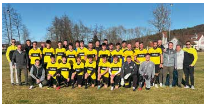
Der FC Faakersee hat sich in Gnas den Feinschliff vor der Frühjahrssaison geholt.

Um sich den Feinschliff für die anstehende Frühjahrssaison zu holen, hielt die Kampfmannschaft gemeinsam mit der U17-Mannschaft bereits zum zweiten Mal ein rundum gelungenes wie intensives Teambuilding in der Steiermark in Gnas ab. Durch einen perfekten Mix aus Trainingseinheiten und Teambuilding-Maßnahmen wurde der Grundstein für einen erfolgreichen Start in die Frühjahrssaison gelegt. Ein Testspiel gegen den steirischen Gebietsliga-Verein SV Mühlendorf konnten die Faaker klar mit 5:2 gewinnen. Alle mitgereisten Spieler kamen bei diesem Testspiel zum Einsatz, bei dem sich vor allem viele junge Talente der U17-Mannschaft sehr stark präsentierten und damit Trainer Gustl Schaller bei den bevorstehenden Aufstellungen wohl großes Kopfzerbrechen bereiten werden. Mit nur zwei Punkten Rückstand auf den Tabellenführer SV Rothenthurm wollen die Faaker Kicker den Angriff auf den Meistertitel starten.