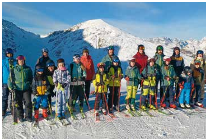
Gemeinsames Trainingslager des SV Faaker See in St. Jakob im Defereggental mit Trainern, Eltern und Nachwuchssportlern.

Äußerst erfreulich verlief der Wiedereinstieg des SV Faaker See mit einer Renngruppe im Kinder-Landescup. Zehn Nachwuchsathletinnen und -athleten im Alter von sieben bis zwölf Jahren konnten sich erfolgreich mit der Konkurrenz auf Landesebene messen. In über 40 Trainingseinheiten am Mölltaler Gletscher, auf der Gerlitzten und am Goldeck sowie beim Trainingslager in St. Jakob im Defereggental wurden die Kinder vom engagierten Trainerteam optimal vorbereitet. Obwohl alle als Neueinsteiger in der höchsten Rennklasse Kärntens an den Start gingen, zeigte sich im Laufe der Saison eine deutliche Leistungssteigerung.