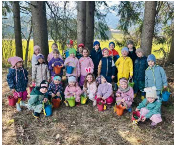
Strahlende Kinder des Kindergartens Fürnitz mit ihren gefundenen Osternestern im Wald.

Im Anschluss führte der Weg in den Keller der Apotheke, wo sich das umfangreiche Medikamentenlager befindet. Besonders begeistert waren die Kinder von der kleinen „Wohnung“, die den Mitarbeiterinnen und Mitarbeitern als Aufenthaltsraum während der Pausen und Bereitschaftsdienste dient.