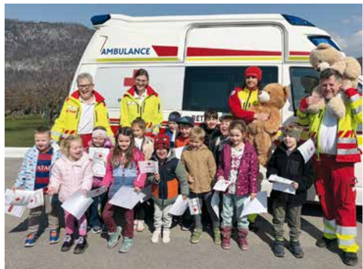
Große Freude bei den Kindern des Kindergartens Fürnitz über den Besuch der Teddybär-Ambulanz des Roten Kreuzes.

Mit viel Geduld wurden die Teddybären verarztet, Verbände angelegt und Pflaster geklebt. Bei der nächsten Station lernten die Kinder den Notfallrucksack sowie verschiedene Geräte der Rettung kennen. Blutdruckmessgerät, Pulsmesser und Beatmungsgerät wurden anschaulich erklärt und konnten sogar ausprobiert werden. Ein besonderes Highlight war der Rettungswagen vor dem Kindergarten. Die Kinder durften einen Blick ins Innere werfen, das Blaulicht betätigen und sogar hinter dem Lenkrad Platz nehmen. Eine kleine Rundfahrt im Transportsessel sorgte zusätzlich für Begeisterung. Zum Abschluss erhielt jedes Kind eine Urkunde sowie ein kleines Geschenk, überreicht vom Leiter der Teddybär-Ambulanz, Herrn Dietmar Tschudnig.