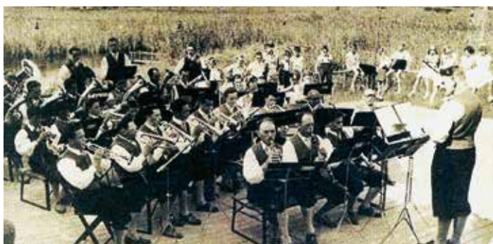
Historische Aufnahme aus den Anfangsjahren der jungen Trachtenkapelle Finkenstein-Faakersee bei einem ihrer ersten Auftritte.