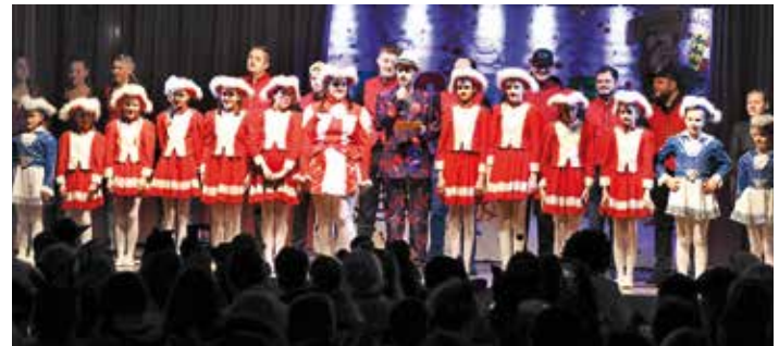
Das große Finale vereinte alle Mitwirkenden auf der Bühne und sorgte für begeisterten Applaus.

Mit viel Einsatz, Kreativität und Gemeinschaftssinn ist es den beiden Gruppen erneut gelungen, den Fasching in der Gemeinde zu einem besonderen Erlebnis zu machen.