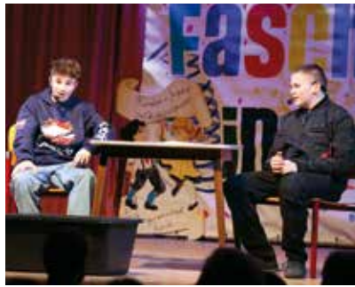
Humorvolle Sketche brachten Alltagssituationen pointiert auf die Bühne.

Am 7. und 8. Februar 2026 luden die Kindervolkstanzgruppe Fürnitz sowie die Volkstanzgruppe Fürnitz/Faaker See zur Faschingssitzung ins Kulturhaus Latschach ein und boten dem zahlreich erschienenen Publikum ein ebenso abwechslungsreiches wie unterhaltsames Programm. Mit viel Liebe zum Detail und spürbarer Begeisterung gestalteten Kinder und Mitglieder beider Gruppen einen bunten Abend, der keine Wünsche offenließ. Von humorvollen Alltagsszenen über kreative Kochtipps bis hin zu augenzwinkernden Eheberatungen spannte sich ein Programm, das die Besucher immer wieder zum Lachen brachte. Die Darbietungen überzeugten durch Witz, Charme und eine beeindruckende Bühnenpräsenz.