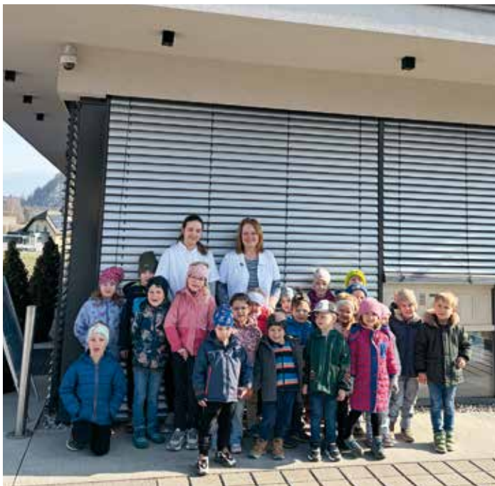
Die Kinder des Kindergartens Fürnitz erhielten spannende Einblicke in die Arbeit der Fürnitzer Apotheke.

Bei herrlichem Frühlingswetter ging es anschließend wieder zurück in den Kindergarten, wo ein erlebnisreicher Vormittag seinen gemütlichen Ausklang fand.