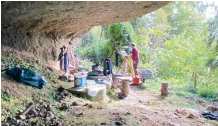
Forschende bei ihren archäologischen Untersuchungen und bei der Freilegung historischer Spuren unter der markanten Felswand in der Halbhöhle „Einziellarca“ am Tabor.

Der Tabor über dem Faaker See ist vielen als beliebter Aussichtspunkt bekannt. Doch hinter der eindrucksvollen Kulisse verbirgt sich weit mehr: An der steil abfallenden Süd- und Westseite des Berges, nahe der Ortschaft Petschnitzen, liegt die sagenumwobene Halbhöhle „Einziellarca“ – ein Ort voller Geschichte und Geheimnisse.