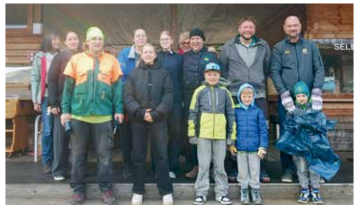
Engagierte Helferinnen und Helfer bei der Flurreinigungsaktion rund um den Aichwaldsee – gemeinsam für eine saubere Umwelt.

Neben dem gemeinsamen Einsatz kam auch der Spaß nicht zu kurz. Zu den ungewöhnlichsten Fundstücken zählten heuer eine unbeschädigte Villacher-Biertulpe, ein Hammer, ein Auspuff, ein Eishockeypuck sowie eine halbe Schneeschaukel. Besonders der Eishockeypuck sorgte für Freude bei einem jungen