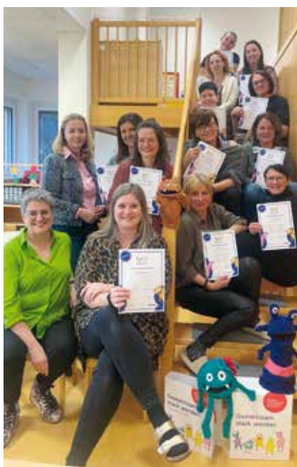
Die Pädagoginnen und Kindergartenassistentinnen der Marktgemeinde Finkenstein am Faaker See nach erfolgreichem Abschluss des Lehrgangs „Gemeinsam stark werden“.

Jedes Kind bringt einzigartige Stärken, Fähigkeiten und Potenziale mit. Den Pädagoginnen und Kindergartenassistentinnen der Marktgemeinde Finkenstein am Faaker See ist es ein zentrales Anliegen, diese von Anfang an achtsam zu erkennen und gezielt zu fördern. Um die Kinder bestmöglich in ihrer Entwicklung zu begleiten, haben die Pädagoginnen und Kindergartenassistentinnen der Kindergärten Ledenitzen, Fürnitz, Finkenstein und Ringa Raja erfolgreich am Ausbildungslehrgang „Gemeinsam stark werden“ teilgenommen. Dieses Programm zur psychosozialen Gesundheitsförderung richtet sich an Kinder im Alter von 0 bis 6 Jahren und unterstützt sie dabei, wichtige Lebenskompetenzen zu entwickeln. Im Mittelpunkt steht ein spielerischer und erlebnisorientierter Zugang: Die Kinder lernen, Vertrauen in sich selbst aufzubauen, ihre Gefühle wahrzunehmen und angemessen mit ihnen umzugehen. Gleichzeitig werden soziale Kompetenzen gestärkt und die Kinder ermutigt, Herausforderungen mit Mut und Zuversicht zu begegnen. Ein besonderer Schwerpunkt liegt auf der Förderung von Selbstbestimmung, Selbstständigkeit und Resilienz. Ziel ist es, die Kinder innerlich zu stärken, damit sie sich sicher in ihrer Lebenswelt bewegen und ihre Persönlichkeit entfalten können. So entsteht ein wertvoller Raum, in dem Kinder ihre individuellen Stärken entdecken, wachsen dürfen und aktiv an ihrer eigenen Entwicklung teilhaben.