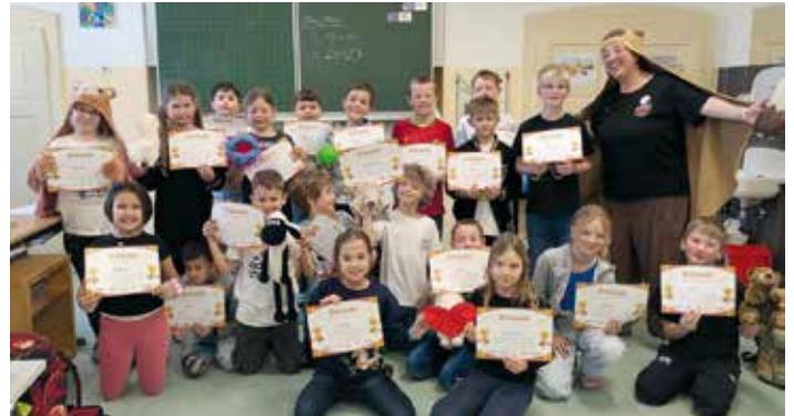
Die Schülerinnen und Schüler der Volksschule Latschach präsentieren stolz ihre Urkunden nach dem Projekt „Bärenstark mit Lissi“.

V letošnjem šolskem letu je na ljudski šoli v Ločah posebno pozornost pritegnila tema krepitve samozavesti in medsebojnih odnosov med učenci. Od decembra do marca so učenci