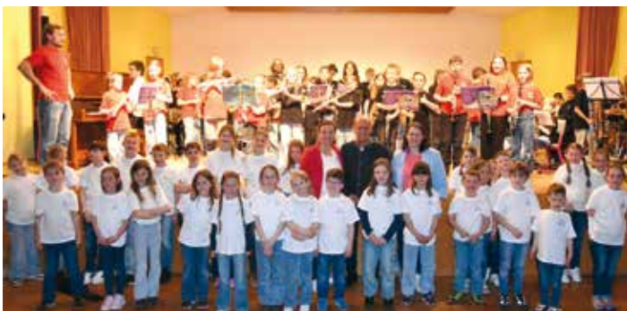
Die jüngsten Ensembles der Musikschule Dreiländereck begeisterten beim Konzert im Kulturhaus Latschach mit großem musikalischem Können.

Ein großes Dankeschön gilt den Eltern, die ihre Kinder stets unterstützen und begleiten. Ebenso gebührt dem gesamten Lehrerteam großer Dank: Mit viel Engagement, Geduld und Leidenschaft fördern sie die musikalische Entwicklung der Schüler und leisten damit wertvolle Arbeit.