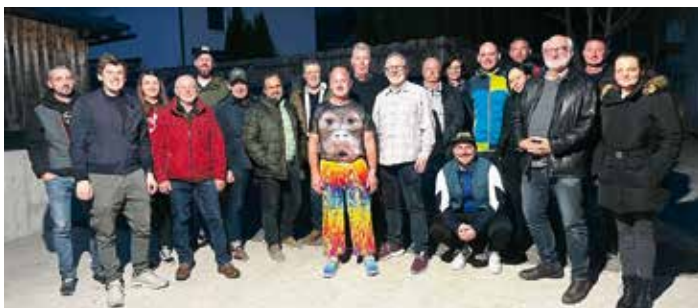
Die Mitglieder der Erneuerbaren-Energie-Gemeinschaft Goritschach bei der Generalversammlung 2026.

Der im Jahr 2022 gegründete Verein kann nach vier Jahren auf eine äußerst erfolgreiche Entwicklung zurückblicken. Insgesamt 17 Mitglieder bzw. Haushalte haben gemeinsam ein beeindruckendes Projekt auf die Beine gestellt und leisten damit einen wichtigen Beitrag zur regionalen Energieversorgung.