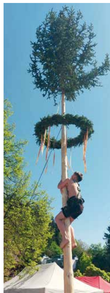
Traditionelles Maibaum- kraxeln als Höhepunkt der 1.-Mai-Feier in Latschach.

Die Dorfgemeinschaft Latschach freut sich auf zahlreiche Gäste und einen geselligen Feiertag im Kreise der Bevölkerung.