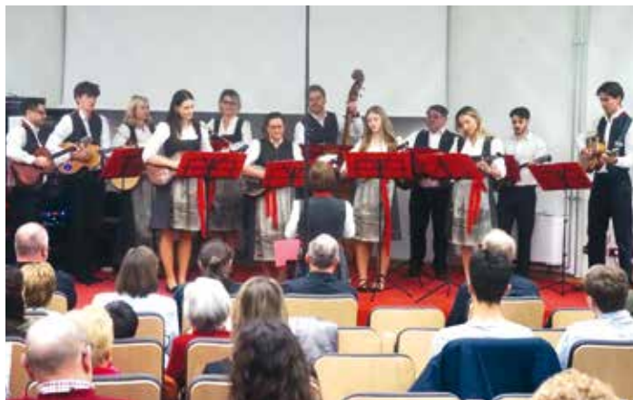
Das Ensemble begeisterte beim Konzert „Koroška in Primorska pojeta“ mit einem abwechslungsreichen Programm.

Že drugič smo imeli čast nastopiti na tradicionalnem koncertu „Koroška in Primorska pojeta“, in sicer 15. marca letos. Orga-