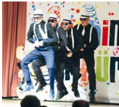
Moderne Tanzeinlagen sorgten für Abwechslung und mitreißende Stimmung.

Besonders hervorzuheben war das Engagement der jüngsten Mitwirkenden. Mit bemerkenswerter Selbstverständlichkeit standen sie im Rampenlicht, zeigten ihr schauspielerisches Talent und begeisterten mit schwungvollen Tanzeinlagen. Dabei wurde deutlich, wie viel Freude und Herzblut in der gemeinsamen Vereinsarbeit steckt.