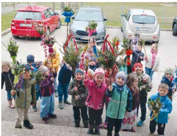
Mit ihren bunt geschmückten Palmbuschen ziehen die Kinder des Kindergartens Finkenstein rund um das Gebäude – ein Brauch, der Glück bringen soll.

Der Palmbuschen gehört in vielen Regionen fest zur Ostertradition und ist auch im Kindergarten Finkenstein ein ganz besonderes Ritual, auf das sich die Kinder jedes Jahr freuen. Am Montag nach dem Palmsonntag bringen die Kinder ihre liebevoll gebundenen Palmbuschen mit in den Kindergarten. Diese bestehen meist aus Zweigen wie Weidenkätzchen, Buchsbaum oder anderen immergrünen Pflanzen und sind oft mit bunten Bändern geschmückt. Manchmal verstecken sich sogar kleine Süßigkeiten darin. Jeder Palmbuschen ist ein kleines Kunstwerk und zeigt die Kreativität sowie das Engagement der Familien. Ein Höhepunkt dieses Brauchs ist das gemeinsame dreimalige Umrunden des Kindergartens. Fröhlich ziehen die Kinder im Kreis um das Gebäude, halten ihre Buschen fest in den Händen und erleben dabei ein starkes Gemeinschaftsgefühl. Dem Brauch wird eine besondere Bedeutung zugeschrieben: Das dreimalige Umrunden soll Glück bringen – für die Kinder, ihre Familien und den Kindergarten. Gleichzeitig stehen die grünen Zweige symbolisch für neues Leben, Hoffnung und den Frühling. Solche Traditionen sind für Kinder von großer Bedeutung. Sie vermitteln Werte, stärken das Miteinander und lassen gelebtes Brauchtum weiterbestehen. Mit viel Freude und strahlenden Augen tragen die Kinder so ein Stück Kultur weiter.