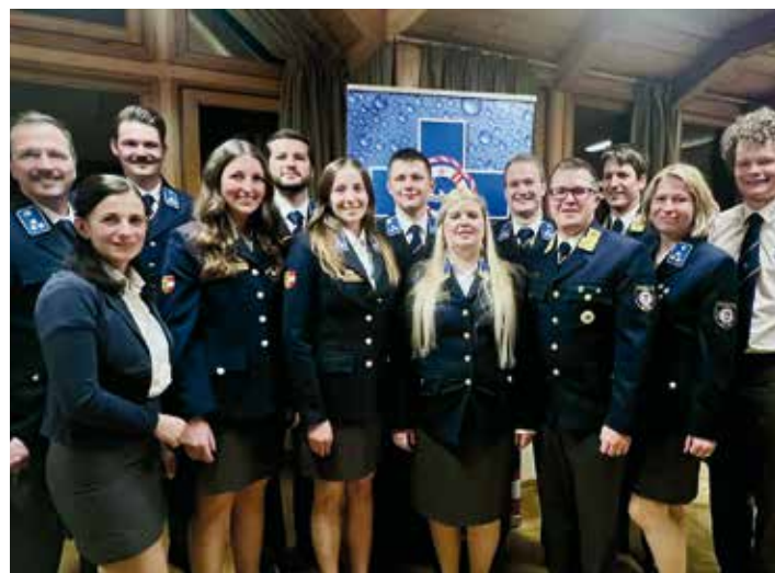
Der neu gewählte Vorstand der Wasserrettung Faaker See für die Funktionsperiode 2026 bis 2030.