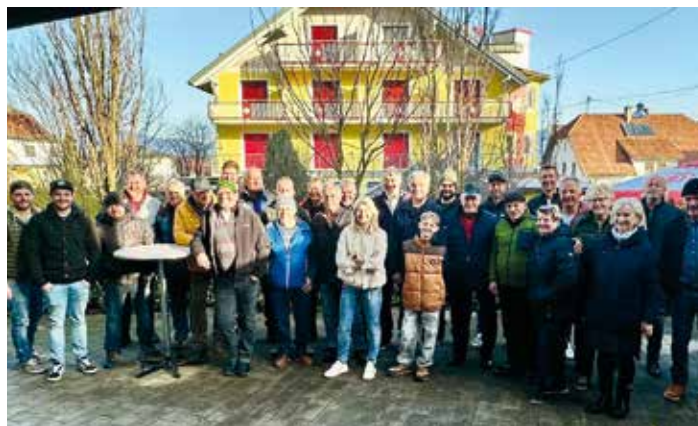
Die Teilnehmer des Dankeschön-Turniers nach spannenden Wettkämpfen zum Saisonabschluss auf der Stockbahn.

Nach dem sportlichen Wettkampf klang der gelungene Tag bei einem gemütlichen Beisammensein mit Buffet und anschließender Siegerehrung aus.