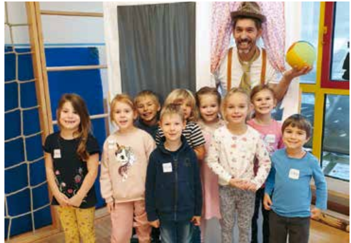
Bei vielfältigen Übungen und Spielen hatten die Vorschulkinder sehr viel Spaß.