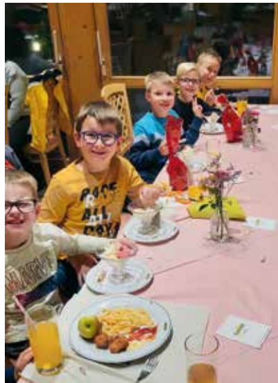
Die Kinder ließen sich die köstlichen Schnitzel mit Pommes schmecken.