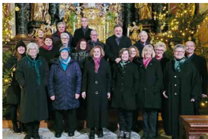
Der FaakerSeeKlång blickt auf eine festliche und emotionale Adventzeit zurück.

Der FaakerSeeKlång blickt dankbar auf eine festliche und musikalisch erfüllte Advent- und Weihnachtszeit zurück, in der musikalische Höhepunkte und die festliche Atmosphäre die Herzen der Zuhörer berührten, und freut sich schon auf kommende kulturelle Höhepunkte im neuen Jahr, wie den Konzertabend am 18. Mai 2024 im Kulturhaus Latschach, welcher unter dem Motto „Jagd“ stehen wird.