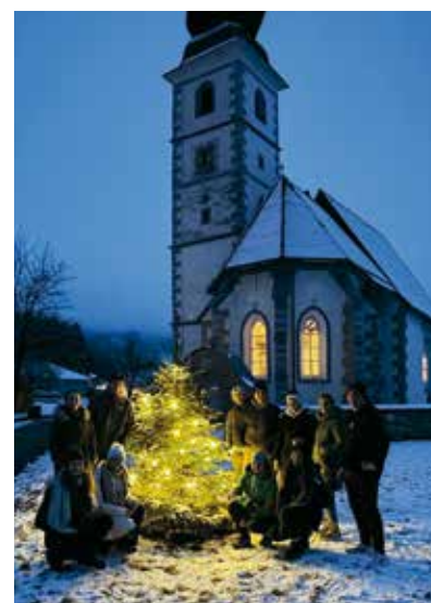
Vor der Kirche in St. Job pflanzten die Mädchen und Burschen schon vor dem Basar einen Baum.

In diesem Sinne, möchten wir uns für jede tatkräftige Unterstützung von euch bedanken. Wir freuen uns schon sehr auf das heurige Jahr mit all seinen bevorstehenden Festen und laden euch recht herzlich dazu ein, mit uns mitzufeiern. Die Burschenschaft St. Job – Sigmontitsch wünscht euch einen guten Start ins Jahr 2024.