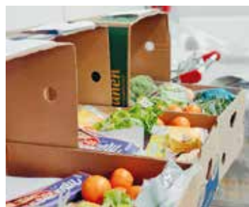
Ein Bananenkarton mit Lebensmitteln, die im Lebensmittelhandel nicht mehr abgegeben werden dürfen, zum Unkostenbeitrag von 20 Euro.