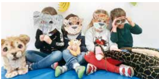
Die Kindergartenkinder aus Ledentzen erleben in der Faschingszeit eine spannende Safaritour durch den Dschungel.