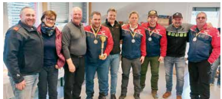
Die zweitplatzierte Moarschaft Gödersdorf 2.