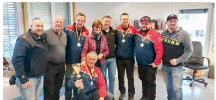
Die Hausherren aus Finkenstein übten sich in Zurückhaltung und durften sich über den 3. Platz freuen.