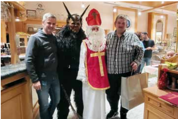
Der Besuch des Nikolaus war für die Kinder der Höhepunkt der Abschlussfeier.

Nachwuchskicker war aber der mit Spannung erwartete Besuch vom Nikolaus. Als Belohnung für ihren Einsatz überreichte der Nikolaus den Kindern ein Nikolosackerl und hatte auch noch einige motivierende Worte für die Kleinen im Gepäck.