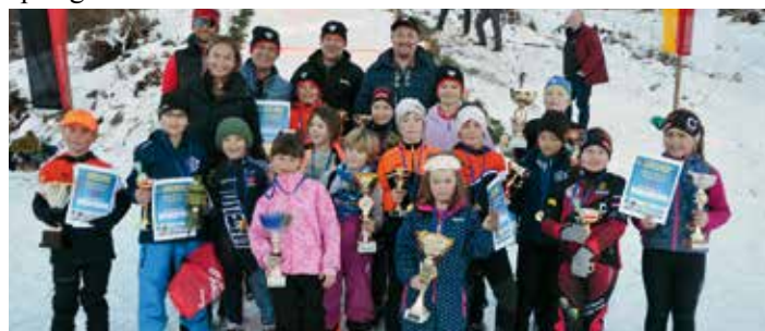
Die Gewinner des diesjährigen Joško Wrolich Gedenkrennens.

Auch die Kinder des Joško Wrolich Gedenkrennens/tek v spomin Joška Wrolich hatten großen Spaß und wurden für ihre Leistungen mit Pokalen und schönen Sachpreisen belohnt. Die Dorfgemeinschaft bedankt sich bei allen Sponsoren und der Marktgemeinde Finkenstein für die großzügige Unterstützung und freut sich schon auf die 45. Auflage des Grenzlandspringens im kommenden Jahr.