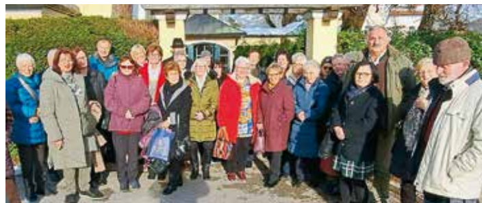
Vor dem Konzert im Festspielhaus kehrten die Senioren im Friesacherhof in Anif ein.