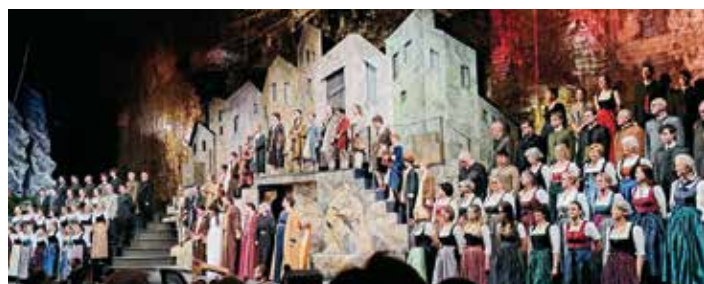
Die Teilnehmer erlebten eine grandiose Vorführung der Solisten, des Chors, der Musiker und nicht zuletzt die großartige und gewaltige Bühnengestaltung.