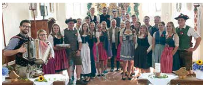
Die feschen Mädchen und Burschen der Burschenschaft St. Job und Sigmontitsch nach der Messe in der Kirche St. Job.

Unsere letzte Veranstaltung des vergangenen Jahres war der Weihnachtsbasar am 8. Dezember in der Kirche in St. Job. Im Vorfeld