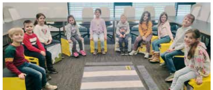
Die angehenden Schulkinder des Kindergartens Latschach im ÖAMTC-Mobilitätspark, bereit für spannende Workshops rund um Verkehrssicherheit und Erste Hilfe.

Mitte November erlebten die angehenden Schulkinder des Kindergartens Latschach einen spannenden Ausflug in den ÖAMTC-Mobilitätspark in Villach. Schon die Zugfahrt nach Warmbad Villach war für die Kinder ein aufregendes Erlebnis. Im Mobilitätspark nahmen die Kinder an zwei lehrreichen Workshops teil. Beim „Kleinen Straßen 1x1“ lernten sie, was ein Zebrastreifen ist, wie man diesen sicher überquert und welche Bedeutung die Ampelfarben im Straßenverkehr haben. Spielerisch und anschaulich wurden ihnen wichtige Grundlagen für ein sicheres Verhalten als Fußgänger vermittelt. Der zweite Workshop, „Das 1x1 der Erstversorgung“, führte die Kinder in die Welt der Ersten Hilfe ein. Mit großem Interesse übten sie, Pflaster und Verbände anzulegen, und erhielten kindgerechte Erklärungen zu den Aufgaben von Rettung, Feuerwehr und Polizei. Auch die Notrufnummern wurden gemeinsam besprochen. Zum Abschluss dieses spannenden und lehrreichen Vormittags erhielt jedes Kind einen kleinen Erste-Hilfe-Ausweis und eine ÖAMTC-Krone – eine schöne Erinnerung an einen Tag voller neuer Eindrücke und wertvollen Erfahrungen.