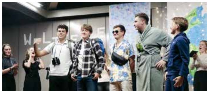
Die männlichen Weltreisenden sorgten für einen unvergesslichen musikalischen Höhepunkt.