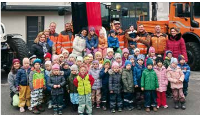
Die Kinder mit ihren Begleiterinnen zusammen mit den engagierten Mitarbeitern des Wirtschaftshofes.

Interessant waren die Einblicke in die Werkstätten, wo die Kinder hautnah miterleben durften, wie Holz und Metall bearbeitet werden. Besonders viel Spaß bereitete das Ausprobieren des Hochdruckreinigers. Doch der Höhepunkt für die kleinen Gäste war zweifellos die Präsentation der großen Schneeräumgeräte. Mit leuchtenden Augen stiegen die Kinder in die Führerstände der mächtigen Maschinen und fühlten sich wie echte Wirtschaftshof-Mitarbeiter. Auch andere Großgeräte standen für die kleinen Besucher bereit, während die freundlichen Mitarbeiter mit Geduld erklärten, wofür sie verwendet werden, und die vielen Fragen der Kinder beantworteten.