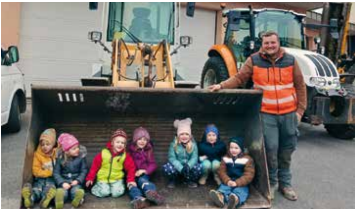
Sieben Kindergartenkinder passen locker in die Schaufel eines Radladers.

Ein aufregender und lehrreicher Tag erwartete die Kinder des Kindergartens Finkenstein bei ihrem kürzlichen Besuch des Wirtschaftshofes der Gemeinde. Mit strahlenden Augen und großer Neugier tauchten die Kleinen in die faszinierende Welt der Wirtschaftshofarbeit ein und durften einen Blick hinter die Kulissen werfen. In kleinen Gruppen aufgeteilt, erkundeten die Kinder die verschiedenen Stationen des Wirtschaftshofes. Sie bestaunten nicht nur die beeindruckenden Maschinen und Geräte, sondern lernten auch die Menschen kennen, die täglich hier arbeiten, und erfuhren mehr über ihre spannenden Aufgaben.