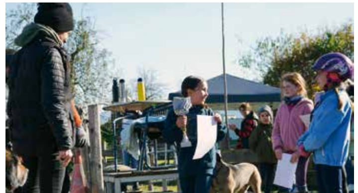
Eine junge Reiterin bei der Siegerehrung.

Disziplinen und begeisterten Zuschauer und Jury gleichermaßen. In den Kategorien Dressur, Springen und einem Geschicklichkeitsbewerb präsentierten die Teilnehmer, was sie in den letzten Monaten auf dem Ponyhof gelernt haben. Besonders stolz sind die Organisatoren darauf, dass auch weniger erfahrene Reiter eine Chance bekamen: Für Anfänger wurden Bewerbe im Schritt und Trab sowie ein Parcours mit Cavalettis angeboten. „Uns ist es wichtig, dass alle Kinder, egal wie viel Erfahrung sie haben, teilnehmen und Spaß am Reiten haben können“, so die Betreiber des Ponyhofs. Die Mischung aus sportlichem Ehrgeiz und spielerischen Elementen sorgte für ein abwechslungsreiches Programm, das von Eltern, Großeltern und weiteren Gästen mit viel Applaus honoriert wurde. Das herrliche Wetter trug seinen Teil zu dem gelungenen Tag bei: Glückliche Gesichter, stolze Kinder und beeindruckende Ritten prägten das Turnier. „Es war ein tolles Erlebnis für die Kinder und die Zuschauer. Wir freuen uns schon auf das nächste Turnier!“, sagte eine Besucherin. Der Ponyhof KlippKlapp bedankt sich bei allen Teilnehmern, Helfern und Gästen für dieses unvergessliche Herbstturnier und freut sich darauf, auch in Zukunft kleine und große Reiterträume zu erfüllen.