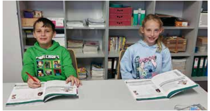
Neben Lernspielen und Laptops kommen im Slowenisch-Unterricht auch klassische Schulbücher zum Einsatz.

lich. Durch die enge wirtschaftliche Zusammenarbeit zwischen Österreich und Slowenien steigt die Nachfrage nach zweisprachigen Fachkräften. Außerdem erleichtert die Beherrschung einer slawischen Sprache den Zugang zu weiteren Sprachen dieser Sprachfamilie.