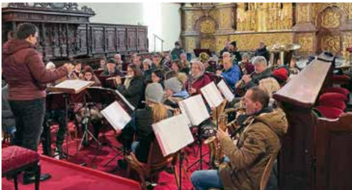
Die Adventkonzerte der Trachtenkapelle Finkenstein – Faaker See sorgten für eine stimmungsvolle vorweihnachtliche Atmosphäre.