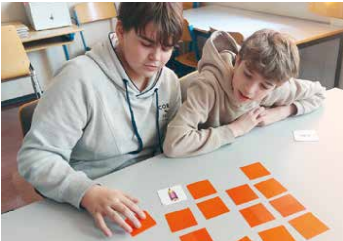
Spielerisch erlernen die Schüler slowenische Begriffe.

Slowenischkenntnisse sind besonders in der Grenzregion nützlich.