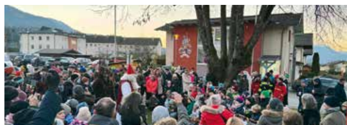
Rund um den Nikolaus herrschte großer Andrang.

Die Dorfgemeinschaft bedankt sich herzlich für den großartigen Besuch. Der Erlös wird für die Errichtung einer Langlaufloipe und einer Bobbahn verwendet, die den Kindern der Volksschule zugutekommen werden.