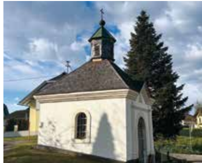
Die Oberrainer Ortskapelle erstrahlt nach der umfassenden Renovierung wieder im neuen Glanz.