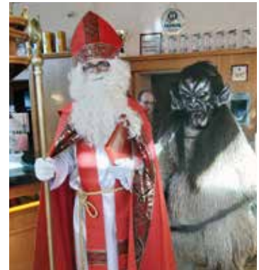
Der Nikolaus und sein Krampus sorgten bei der Weihnachtsfeier der Ortsgruppe Gödersdorf für eine fröhliche und zugleich spannende Stimmung.