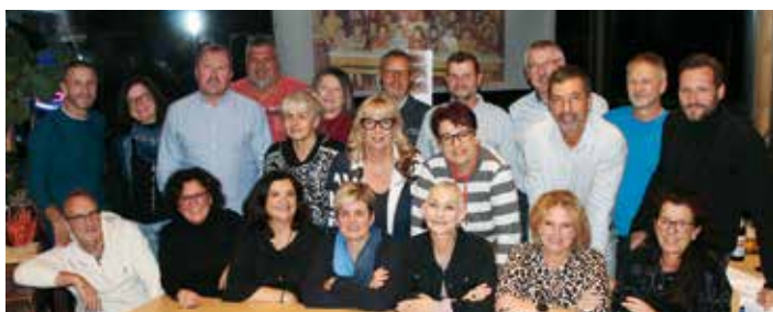
...und heute 50 Jahre später.