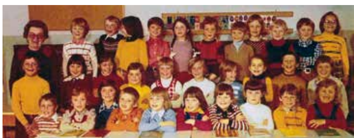
Die erste Klasse der VS Latschach damals im Jahr 1974/75...

Anlässlich des 50-jährigen Wiedersehens der ersten Klasse 1974/75 der Volksschule Latschach fand ein besonderes Klassentreffen im Martinihof statt. Von den insgesamt 31 ehemaligen Schülerinnen und Schülern nutzten 21 die Gelegenheit, sich nach all den Jahren wiederzusehen. Der Abend war geprägt von guter Stimmung und zahlreichen Gesprächen über die vergangenen Jahrzehnte. Gemeinsam wurde viele Erinnerungen ausgetauscht und Anekdoten aus der Schulzeit erzählt, die für viele Lacher sorgten. Das Treffen war ein großer Erfolg und bewies einmal mehr, wie stark die Verbundenheit unter den ehemaligen Schülern auch nach so langer Zeit geblieben ist. Ein herzliches Dankeschön an alle, die zum Gelingen dieses besonderen Abends beigetragen haben.