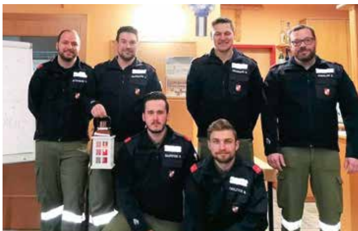
Die Kameradinnen und Kameraden der Freiwilligen Feuerwehr Latschach wünschen frohe Weihnachten und alles Gute für das neue Jahr 2025!

Schon traditionell leuchtet das Friedenslicht zu Weihnachten in vielen heimischen Wohnzimmern. Entzündet in der Geburtsgrube Jesu in Betlehem, wird das Friedenslicht nach Österreich gebracht und dann von Hand zu Hand auch bis in die Marktgemeinde Finkenstein am Faaker See weitergegeben. Auch die Freiwillige Feuerwehr Latschach unterstützt die Verteilung und so kann am 24. Dezember das Friedenslicht von 8:00 bis 12:00 Uhr im Feuerwehrhaus Latschach abgeholt werden. Bitte bringen Sie eine Laterne oder eine Kerze selbst mit.