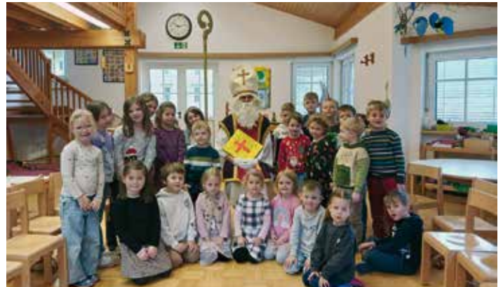
Der Besuch vom Nikolaus zauberte nicht nur den Kindern ein Lächeln ins Gesicht, sondern sorgte auch für eine zauberhafte vorweihnachtliche Stimmung

Am 5. Dezember war die Aufregung im Kindergarten Latschach groß: Der Nikolaus stattete den Kindern einen besonderen Besuch ab. Mit seiner Geschichte über den heiligen Bischof vermittelte er den Kindern spielerisch eine wichtige Botschaft: Teilen macht Freude. Dabei wurde ein Bewusstsein für Gemeinschaft, Miteinander und Nächstenliebe geschaffen. Die Kinder lauschten gespannt, bevor sie mit leuchtenden Augen ihre Nikolaussackerl entgegennehmen durften. Der Vormittag wurde durch eine gemeinsame Jause mit Kakao und frisch gebackenen Semmelkrampussen abgerundet.