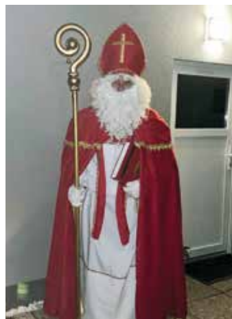
...und 30 Jahre später am 5. Dezember 2024.

Malerei DER Malerei · Anstrich Fassaden · Vollwärmeschutz