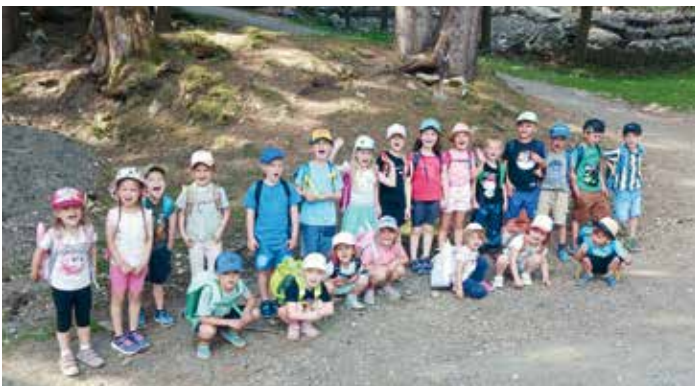
Ein erlebnisreicher Tag im Tierpark Feld am See mit vielen spannenden Entdeckungen und unvergesslichen Eindrücken.

Da das Sommerfest aufgrund der laufenden Bauarbeiten heuer nicht stattfinden konnte, wurde für die Kinder ein besonderer Ausflug in den Tierpark Feld am See organisiert. Bereits die gemeinsame Busfahrt war für viele ein spannendes Erlebnis. Im Tierpark angekommen, konnten die Kinder zahlreiche Tiere beobachten und viel Neues entdecken. Die Begegnungen mit den Tieren, das gemeinsame Erleben und die vielen interessanten Eindrücke machten den Tag zu etwas ganz Besonderem. Mit großer Begeisterung erkundeten die Kinder die Anlage und genossen jeden Moment dieses gelungenen Ausflugs. Der Besuch im Tierpark war eine wunderbare Alternative zum Sommerfest und wird den Kindern sicherlich noch lange in schöner Erinnerung bleiben. Ein herzliches Dankeschön an Bürgermeister Christian Poglitsch sowie an die Kindergartenreferentin für die Übernahme der Buskosten. Durch ihre großzügige Unterstützung wurde dieses besondere Erlebnis erst möglich gemacht. Der Kindergarten Latschach bedankt sich herzlich für die wertvolle Unterstützung und die Freude, die den Kindern mit diesem Ausflug bereitet wurde.