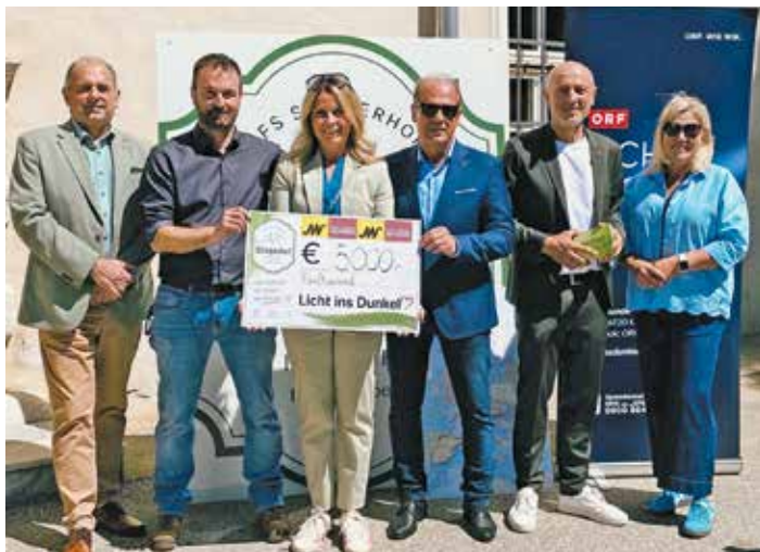
Bei der Abschlussveranstaltung des Projekts „Stiegerhof HOPP HOPP – Mit dem Rad zur Schule“ konnte ein Spendenscheck über 5.000 Euro an Licht ins Dunkel übergeben werden.