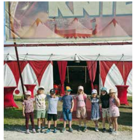
Strahlende Gesichter vor dem Zirkuszelt: Der Ausflug zum Circus Louis Knie war für die angehenden Schulkinder ein besonderes Erlebnis zum Abschluss ihrer Kindergartenzeit.

Einen unvergesslichen Tag erlebten die angehenden Schulkinder bei ihrem Ausflug zum Circus Louis Knie in Faak am See. Bereits der Weg dorthin war ein kleines Abenteuer: Gemeinsam machten sich die Kinder zu Fuß von Latschach auf den Weg nach Faak. Nach der Wanderung stärkten sie sich bei einer gemütlichen Jausenpause, bevor der Höhepunkt des Tages auf dem Programm stand. Dann war es endlich so weit: Der Besuch im Circus Louis Knie begeisterte die Kinder von der ersten Minute an. Die beeindruckenden Darbietungen der Artisten, die lustigen Einlagen des Clowns und die spektakulären Vorführungen sorgten für staunende Gesichter und große Begeisterung. Mit leuchtenden Augen verfolgten die Kinder das abwechslungsreiche Programm und ließen sich von der faszinierenden Welt des Zirkus verzaubern. Nach dem aufregenden Zirkusbesuch ging es wieder zu Fuß zurück zum Kindergarten, wo bereits das Mittagessen auf die hungrigen Ausflügler wartete. Für die angehenden Schulkinder war dieser besondere Ausflug ein gelungener Abschluss ihres letzten Kindergartenjahres. Die vielen Eindrücke und gemeinsamen Erlebnisse werden ihnen sicherlich noch lange in schöner Erinnerung bleiben.