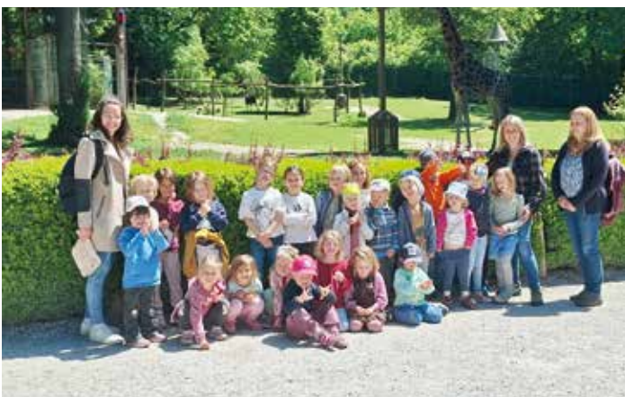
Die Kinder von Ringa raja verbrachten einen spannenden und erlebnisreichen Tag im Zoo von Ljubljana und entdeckten dabei die faszinierende Welt der Tiere aus nächster Nähe.

Der Zoo in Ljubljana bot uns einen interessanten Einblick in die vielfältige Tierwelt. Wir sahen zahlreiche afrikanische Tiere, die uns sehr begeistert haben. Besonders interessant war es, die Fütterung der Seelöwen zu beobachten, da sie sehr verspielt und geschickt waren. Nach dem Besuch bei den Tieren