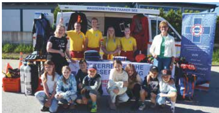
Die Österreichische Wasserrettung Faaker See stellte ihre Ausrüstung vor und informierte die Kinder über ihre vielfältigen Aufgaben.