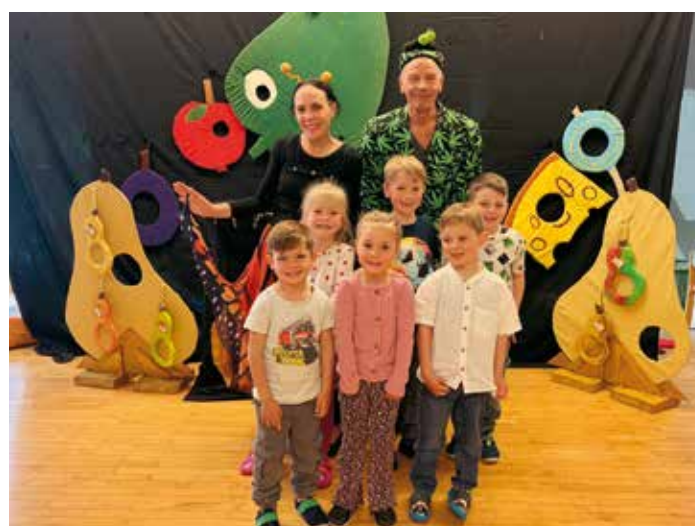
Gemeinsam mit den Darstellern des „Quasi Quaser“-Theaters erlebten die Kinder einen abwechslungsreichen und unterhaltsamen Vormittag.

Vor Kurzem erwartete die Kinder des Kindergartens Fürnitz ein ganz besonderer Vormittag. Das „Quasi Quaser“-Theater war – wie jedes Jahr – mit dem liebevoll inszenierten Stück „Die kleine Raupe Pumperlsund“ zu Besuch und begeisterte Groß und Klein. Mit viel Charme, Humor und Einfühlungsvermögen erzählten und spielten die beiden Darsteller die Geschichte der kleinen Raupe, die sich durch die unterschiedlichsten Leckereien fraß und dabei eine spannende Reise bis hin zum wunderschönen Schmetterling erlebte. Die Kindergartenkinder wurden aktiv in das Geschehen eingebunden und durften mitmachen, mitlachen, mitsingen und mittanzen. Besonders beeindruckend waren die liebevolle Darstellung sowie die kreativen Kulissen und Requisiten, die die Geschichte auf fantasievolle Weise zum Leben erweckten. Von Anfang bis Ende verfolgten die Kinder die Aufführung mit großer Begeisterung und belohnten die Darsteller mit herzlichem Applaus. Nach diesem erlebnisreichen Theaterbesuch freuen sich die Kinder bereits auf das nächste Gastspiel des „Quasi Quaser“-Theaters im kommenden Jahr.