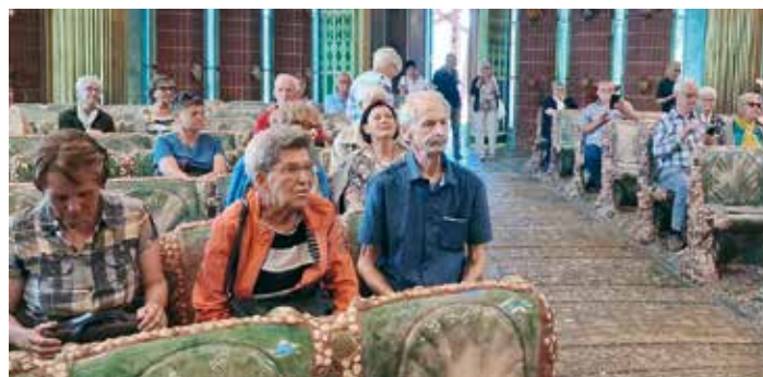
Die Mitglieder der Ortsgruppe Gödersdorf zeigten sich von der beeindruckenden Architektur und den farbenprächtigen Gestaltungselementen der Ernst-Fuchs-Kirche in Thal bei Graz begeistert.