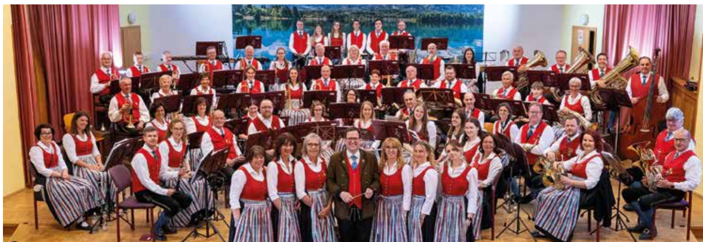
Die Trachtenkapelle Finkenstein–Faaker See feierte ihr 70-jähriges Bestandsjubiläum mit einem festlichen Galakonzert vor ausverkauftem Haus.

Ab Anfang Juli lädt die TKFF wieder zu ihren beliebten Sommerkonzerten ein. Jeweils montags und donnerstags um 20 Uhr erklingt Blasmusik an besonderen Plätzen in der Natur, am Campingplatz, am Seeufer oder in gemütlichen Gastgärten. Ob Einheimische oder Gäste – alle Musikfreunde sind herzlich willkommen. Nähere Informationen und Termine finden Sie auf der Homepage der Trachtenkapelle Finkenstein–Faaker See unter www.tkfinkenstein.at .