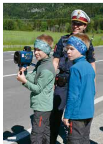
Mit dem Radargerät der Polizei konnten die Kinder selbst Geschwindigkeitsmessungen durchführen.

Ein besonderes Highlight bot die Polizeiinspektion Faak am See. Die Schülerinnen und Schüler durften selbst Radarmessungen an der Gödersdorfer Straße durchführen, Geschwindigkeiten kontrollieren und bei Alkoholtests mit dem Messgerät mitwirken. Dabei wurden zahlreiche Fragen rund um Verkehrssicherheit und Polizeiarbeit beantwortet.