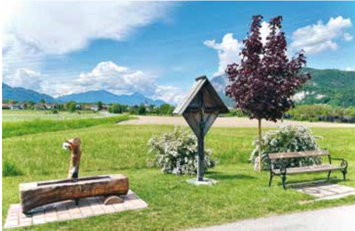
Das revitalisierte Prangerkreuz in Stobitzen schafft eine wunderbare Atmosphäre zum Innehalten.

Wegekreuze sind Orte des Verweilens, Innehaltens und manchmal auch der Andacht. Ein solches Kleinod befindet sich seit jeher in Stobitzen, genauer gesagt am Beginn der Industriestraße, westlich der ehemaligen Pizzeria „Al Prato“.