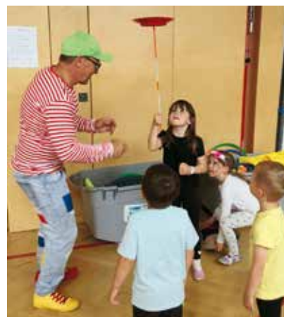
Mit großer Begeisterung probierten die Kinder gemeinsam mit Circus Rico verschiedene Zirkuskünste aus und tauchten in die bunte Welt des Zirkus ein.

Große Freude herrschte vor kurzem, als eine Pädagogin bei einem Gewinnspiel einen Besuch von Circus Rico gewann. Der Gewinn sorgte für viel Begeisterung, denn für einen ganzen Vormittag verwandelte sich der Alltag in eine bunte Zirkuswelt. Mit viel Charme, Humor und Geschick brachte Rico den Kindern die faszinierende Welt des Zirkus näher. Dabei konnten sie verschiedene Kunststücke