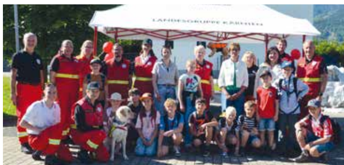
Die Rettungshundebrigade Finkenstein vermittelte Wissenwertes über den richtigen Umgang mit Hunden und ihre wichtige Einsatzarbeit.

An mehreren Stationen erhielten die Kinder wichtige Informationen und praktische Einblicke in die Arbeit der Einsatzorganisationen. Die Rettungshundebrigade Finkenstein vermittelte den sicheren Umgang mit Hunden und beeindruckte mit ihrem