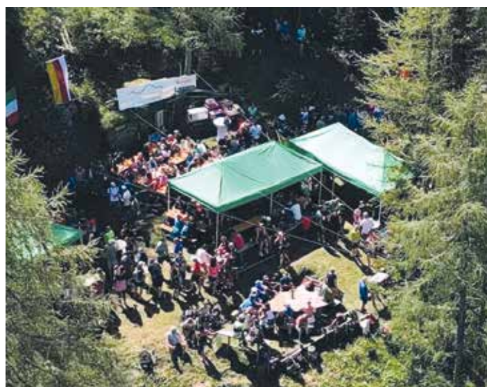
Zahlreiche Gäste werden auch heuer wieder beim traditionellen Annakirchtag auf der Annahütte erwartet.

Ob Mountainbiker, Wanderer oder Ausflügler – alle sind herzlich willkommen und können sich nach der aussichtsreichen Auffahrt über den Alpe-Adria-Trail auf einen stimmungsvollen Almkirchtag freuen. Die Alpbrothers freuen sich auf zahlreiche Besucher!